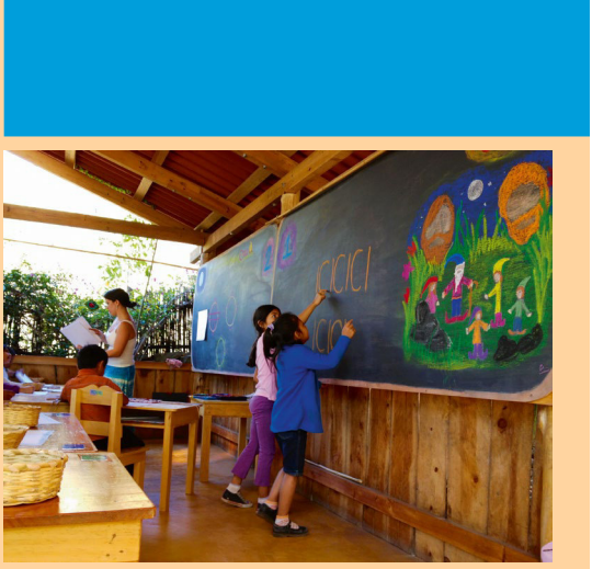
Impressions from life at the Escuela Caracol Waldorf School in Guatemala Right: the new building, co-financed together with the BMZ, both during and after construction