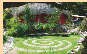
Eindrücke aus dem Schulleben der Waldorfschule Escuela Caracol in Guatemala Rechts: das BMZ finanzierte Gebäude während und nach dem Bau