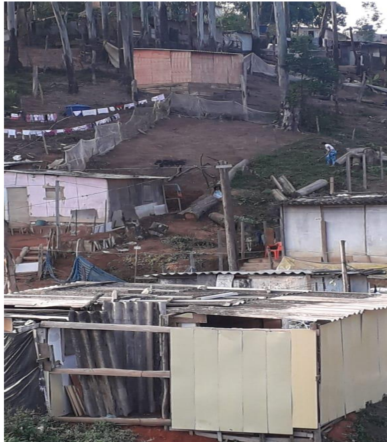
Moradia no Núcleo Horizonte Azul que recebe assistência por parte da Associação com vagas nas creches e nos outros programas educacionais e de saúde com atendimento médico e terapêutico e; neste momento de Pandemia recebem Cestas Básicas e outros insumos para amenizar as dificuldades financeiras que esta época tem apresentado.