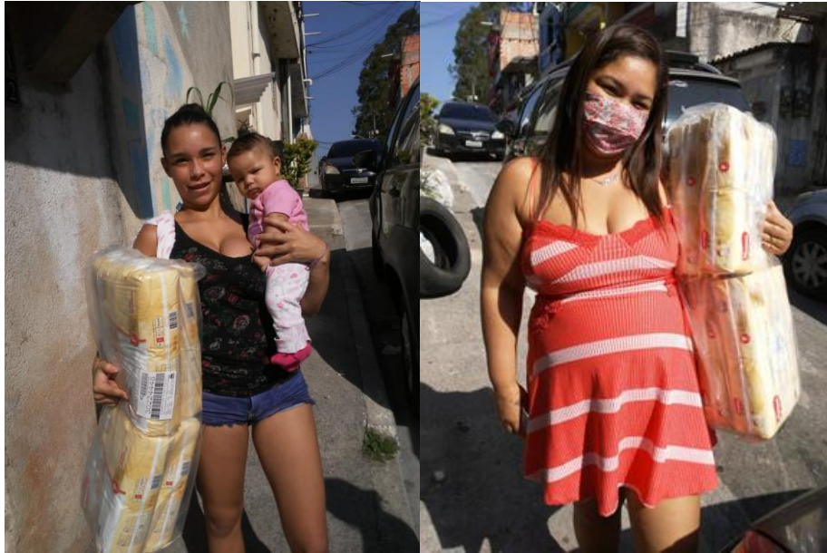
Entrega de fraldas a moradoras com dificuldade financeira no Núcleo Horizonte Azul