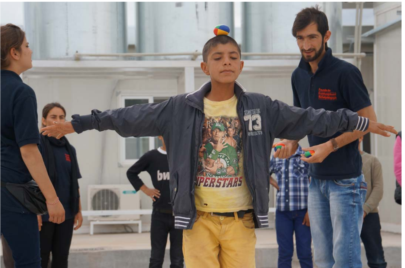
( http://www.ecopressblog.de/wp-content/uploads/2014/09/Balanceübung.jpg )