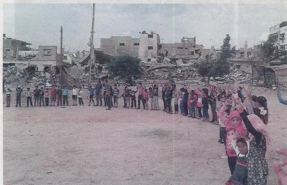
Omringd door puinhopen doen kinderen een spel.

Eén avond in de week werkt de zeventiger als vrijwilliger in Amsterdam, waar hij een medisch spreekuur houdt voor daklozen, illegalen en afgewezen asielzoekers. Eerder werkte hij ruim drie jaar als huisarts in een asielzoekerscentrum. Dat werk heeft hem 'nogal gedepri-meerd'. „Die mensen kunnen niks, mogen niks. Ik had het idee dat wat ik deed pappen en nathouden was.” Bekroop dat deprimerende gevoel hem ook in Gaza? „Minder sterk. Die mensen proberen hun leven weer op te pakken. In asielzoekerscentra wordt dat verhinderd. Het leven staat daar stil en dat wordt door ons veroorzaakt.”