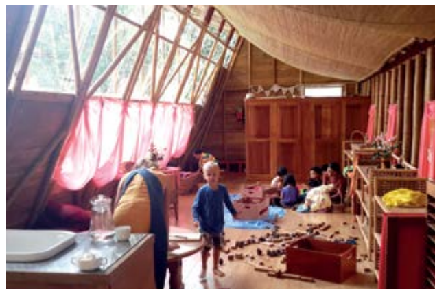
izquierda: Kindergarten en Timisoara, Rumania. derecha: Kindergarten en la escuela Waldorf en Myanmar.