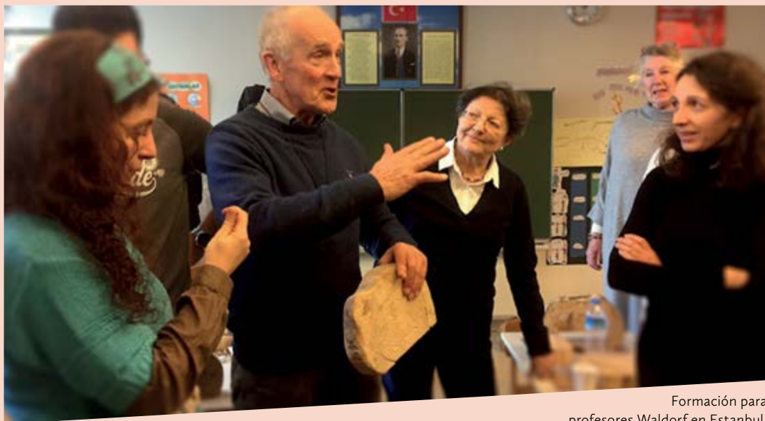
Formación para profesores Waldorf en Estambul.