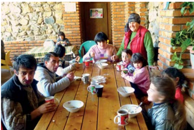
Un lugar de la comunidad: el proyecto social Temi en Georgia.

Todos se ocupan de los niños cuyos padres tienen alguna discapacidad. Se encuentran las más diversas concepciones de vida.