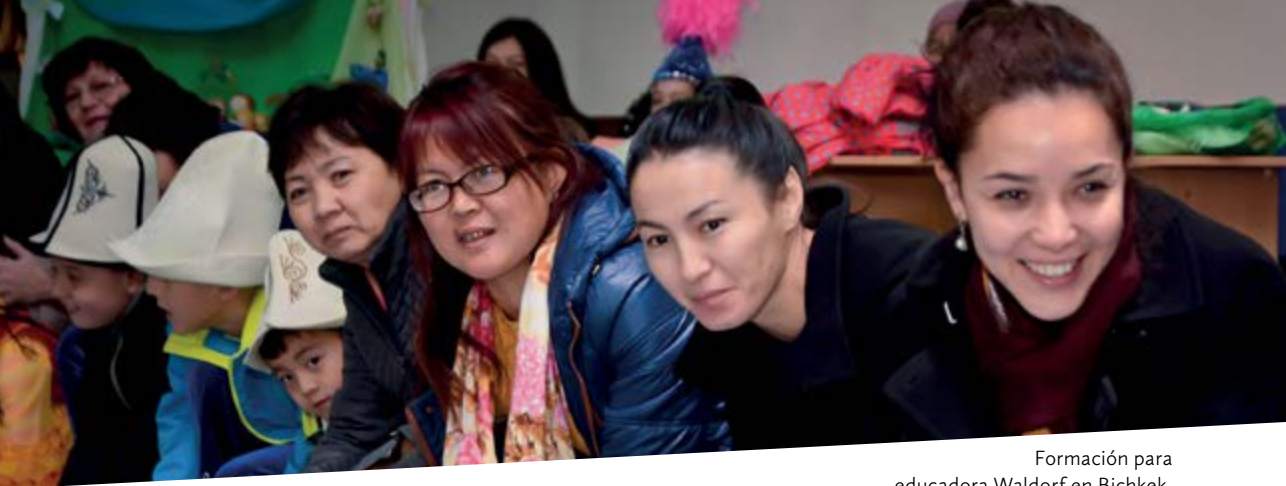
Formación para educadora Waldorf en Bichkek.

El Seminario Waldorf Centroasiático cumple una función especial. Es un seminario abierto que tiene lugar siempre al inicio de junio. En el 2003 comenzó, primero en un marco muy acotado, para dar inicio a un trabajo en conjunto con pedagogos Waldorf de los países limítrofes. A partir de eso surgió un seminario abierto que ha alcanzado los 100 participantes y se ha desarrollado de tal forma, que constituye la vida cultural de Bishkek.