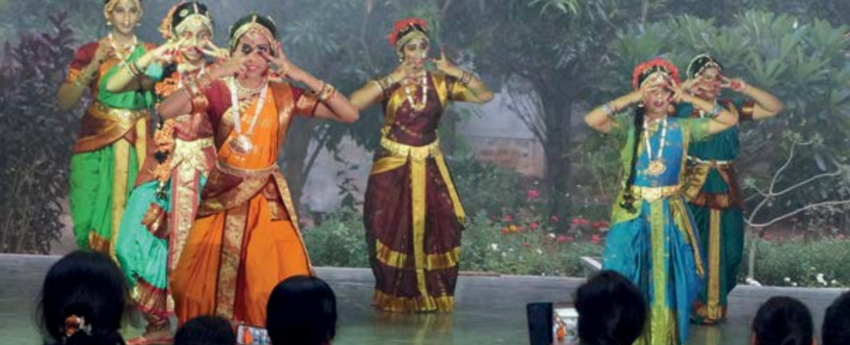
Baile en un evento escolar en la escuela Waldorf de Hyderabad.

colegas británicos pudieron ser financiados para acompañar la construcción, y a través de su trabajo construyendo una bonita casa escolar, deberán convencer a los padres, que según nos contaron los colegas, necesitan primero ver la escuela y luego tomar confianza. No se dejan convencer por una idea.