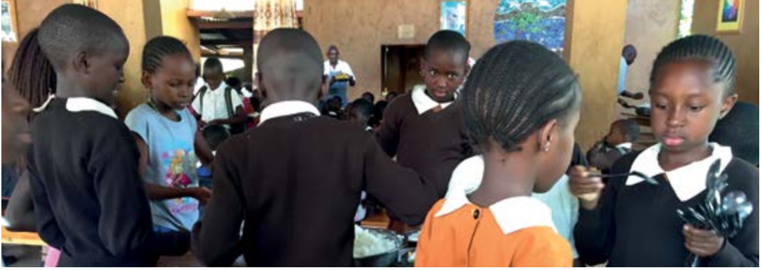
Entrega de comida en el Comedor de la escuela Waldorf en Mbagathi/Nairobi.

tradicional africana existe una fuerte relación y un trato muy cuidadoso hacia la naturaleza, pero al mismo tiempo un vínculo doloroso, porque está totalmente supeditado a los cambios del clima. Mientras no haya una sequía total, como el año pasado, por medio de los sistemas de riego, una buena sombra sobre la superficie del jardín y un buen trabajo con el compost y el abono, pueden crecer verduras incluso en las temporadas secas.