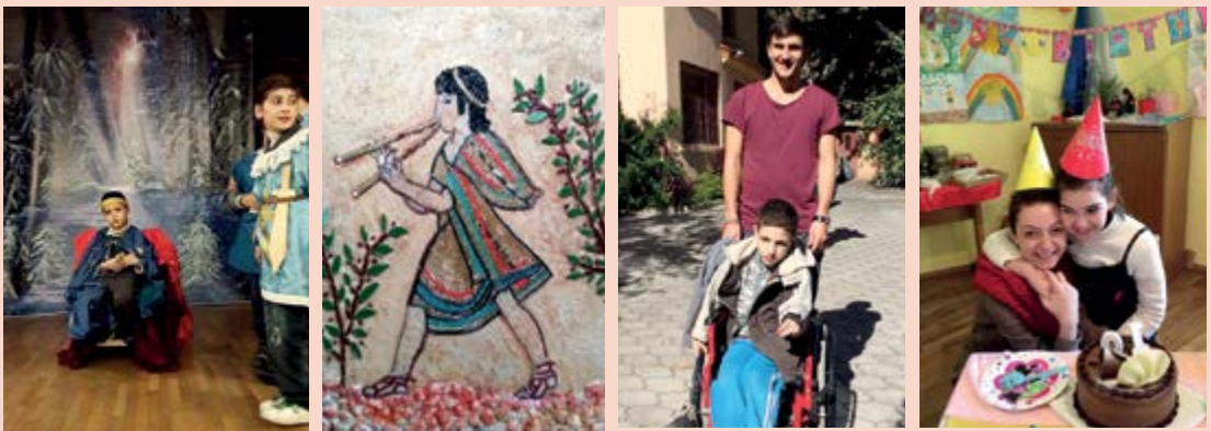
De izq. a der: Obra de navidad del grupo de teatro, un mosaico, desarrollado en el propio taller de mosaico de la escuela, un colaborador voluntario y el cumpleaños de la escuela Micael de Tiflis.

Marina Shostak (Trabajado por Christina Reinthal)