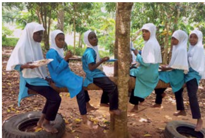
Almuerzo en el patio de recreo.

En los primeros dos años la lengua utilizada en las clases es el Swahili, y a partir del tercer grado, la clase principal se dicta en inglés. El cuidado del calor en los pies, tan discutido en Centroeuropa, se opone a la naturaleza cálida y opulenta. Aquí todos van descalzos a la escuela-selva y quien quiera man-