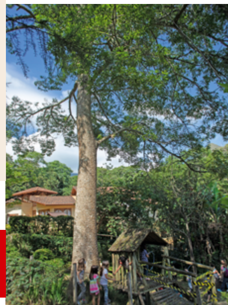
Escuela Waldorf Cecilia Meireles, Nova Fribourgo, Brasil