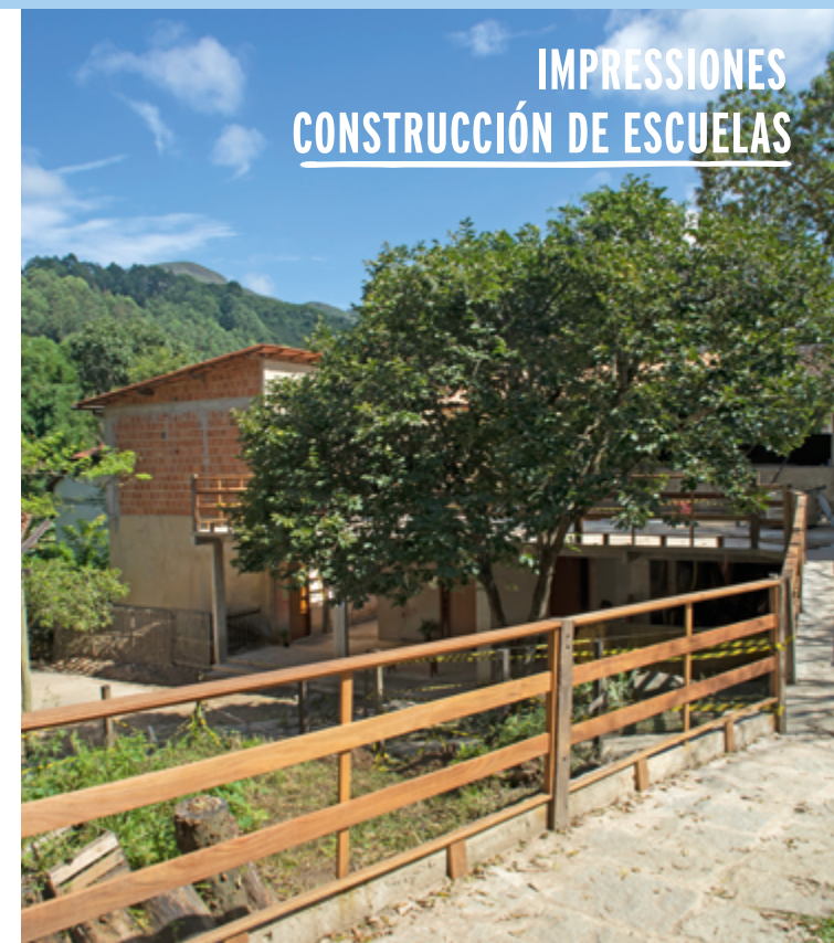
Escuela Waldorf Cecilia Meireles, Nova Fribourgo, Brasil