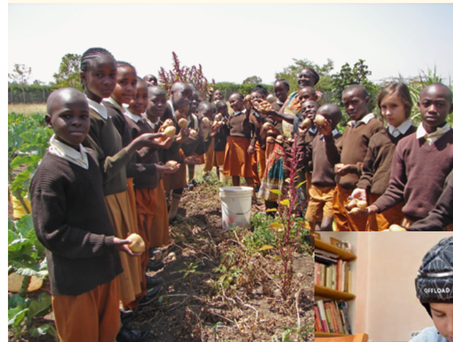
Escuela Rudolf Steiner Mbagathi, Nairobi, Kenia

••• Aimo Hindriks, Paulina Jantos ••• y Fabian Michel ••• Tel. + 49 (0) 30 617026 30 ••• sponsorships@freunde-waldorf.de