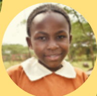
Wayed 7 años 1er grado