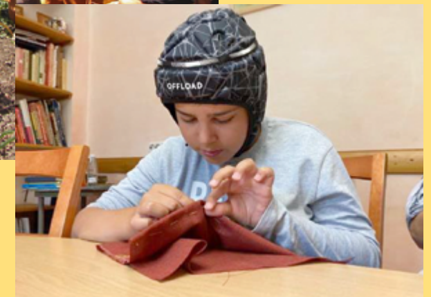
Escuela St. Georg, Moscú, Rusia