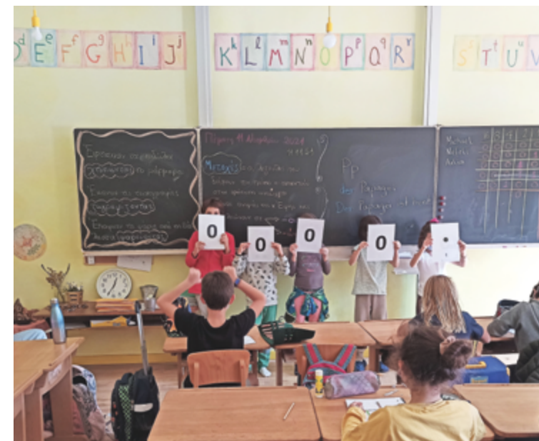
Escuela Waldorf Trianemi, Atenas, Grecia