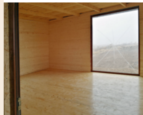
arriba: Liceul Teoretic Waldorf, Chişinău, Moldavia abajo: Escuela Waldorf Yereván, Armenia