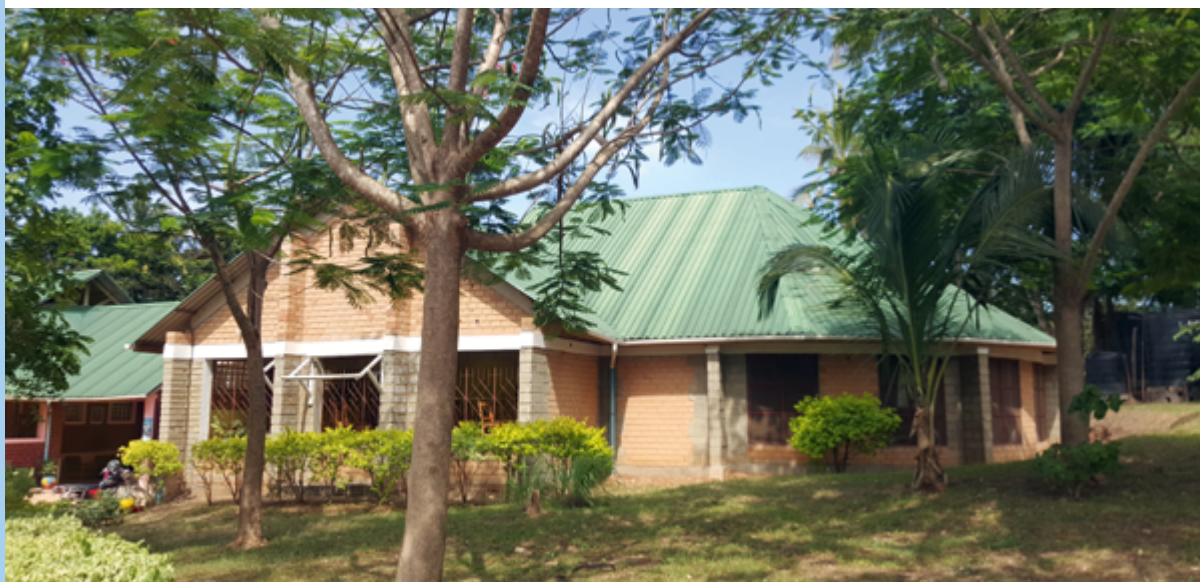
Hekima Waldorf School, Dar es-Salaam, Tanzania