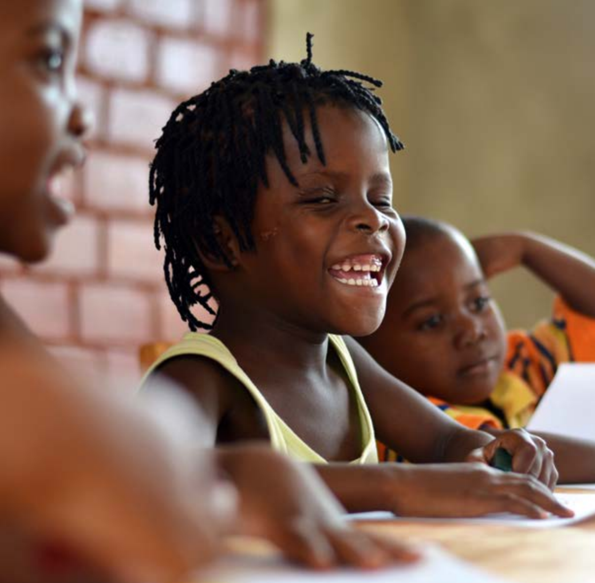
Hekima Waldorf School, Tansania

Más acerca de los Padrinazgos de formación de los Amigos de la Educación Waldorf en www.freunde-waldorf.de