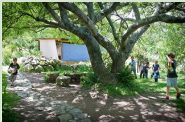
Escuela Caracol, San Marcos La Laguna/ Guatemala

Ministerio Nacional -alemán- de Familia en la temporada pasada la inscripción de jóvenes superó a la cantidad de plazas disponibles. Nosotros acompañamos en 2012 a alrededor de 320 voluntarios nacionales e internacionales en instituciones antroposóficas. Este año llegaron a Alemania 40 participantes de más de 20 países a través del Programa Incoming.