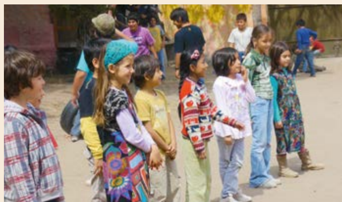
derecha: ahijados de Dulce Esperanza en el Colegio Miguel Angel en Cieneguilla (suburbio de Lima); izquierda: proyecto social de Pedagogía Waldorf Runayay en Lima, barrio Salamanca