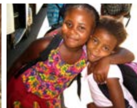
página izquierda: María en Finlandia; arriba: con ahijados de la McGregor Waldorf School, Sudáfrica; derecha: joven madrina reúne dinero con la venta de pasteles

Luego de mi viaje decidimos apoyar a otro niño en Sudáfrica: un joven de 11 años de la Escuela Waldorf Hermanus. Recién lo conocemos. Cuanto más sé de estos niños tanto más me doy cuenta de que son maravillosas personas, como mis hijos. Los amamos como a nuestros hijos, por lo que son. No quisiera imaginarme una vida sin ellos.