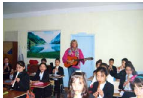
desde la cotidianeidad de la escuela en Chudschand/ Tayikistán; la Pedagogía Waldorf aún no está reconocida por las autoridades educativas de Tayikistán