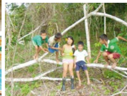
izquierda: proyecto social de Pedagogía Waldorf en Sauce/Perú; derecha: en el pueblo de los Shipibo