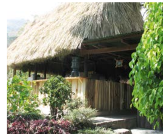
izquierda arriba: vista sobre el mar de Atitlán; derecha: edificio escolar de la Escuela Caracol

Realmente yo apenas podía creer que el nuevo edificio con las tres aulas sería posible en un terreno con un macizo de piedra volcánica. Sin contar que sólo lleva hasta allí una senda empinada a lo largo de 300 mts a través de un bosque de matorrales. No se podía pensar en máquinas pesadas trabajando. Cuando llegué un domingo de noviembre de 2012 para dar inicio a la construcción, se me rompía la cabeza pensando cómo sería posible la obra... pero en fin, al día siguiente llegaron los obreros desde el pueblo, mayas auténticos, con palas, picos, mazas y martillos, para romper a mano la piedra, nivelar el terreno y levantar los fundamentos.