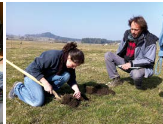
izquierda: primer Camphill de Asia: Peacefull Bamboo Family en Hue/Vietnam; derecha: embajador de los Amigos de la Educación Waldorf para la agricultura bio-dinámica