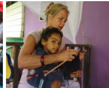
izquierda: Educare Centres/Sudáfrica, derecha: Sea Heart School/Costa Rica

iniciativas jóvenes, sobre todo de regiones en las que la Pedagogía Waldorf aún no ha podido hacer pie: además de algunas regiones de Asia y África, esto ocurre en América Central. En los últimos años aparecieron allí las primeras instituciones: en El Salvador, Guatemala, Costa Rica y en la República Dominicana. Actualmente, la Escuela Caracol de San Marcos La Laguna/ Guatemala está construyendo su edificio a través de nuestro aporte y el cofinanciamiento desde el Ministerio Nacional -alemán- para la Cooperación y el Desarrollo Económico (BMZ). Por otro lado, hemos apoyado la organización de la Formación de Educadores Waldorf para la Primera Infancia, así como su Congreso Anual Centroamericano.