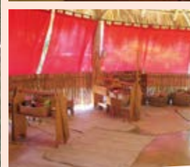
izquierda arriba: comienzo de la construcción financiada en parte por el BMZ; derecha arriba: activo fundador de la escuela/maestro; centro/abajo: predio de la escuela y la cotidianidad en aulas aún abiertas

Jardín de Infancia, cuatro aulas, una pequeña cocina, un taller y un cobertizo, emplazada en un terreno amorosamente parquizado. Dentro de ese proyecto se construirá un segundo Jardín de Infancia y se agrandará la cocina. Luego de terminado, ambos terrenos crecerán en una unidad orgánica. Entonces todos los grados-incluyendo al 6°- podrán tener su propia aula en la segunda mitad de 2013, dando fin a la doble utilización de los espacios. También el 7° grado tendrá su propio espacio en 2014.