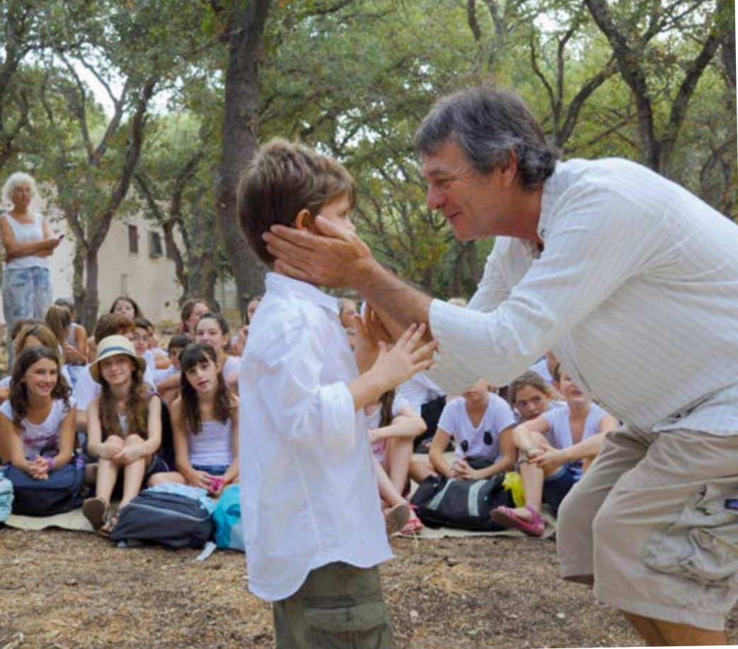
Escuela Waldorf Rimon en Pardes Hannah/Israel