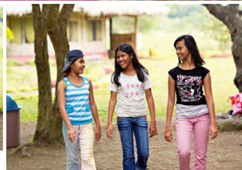
La Gamot Cogon Waldorf School recibió apoyo en los últimos años a través del WOW-Day.