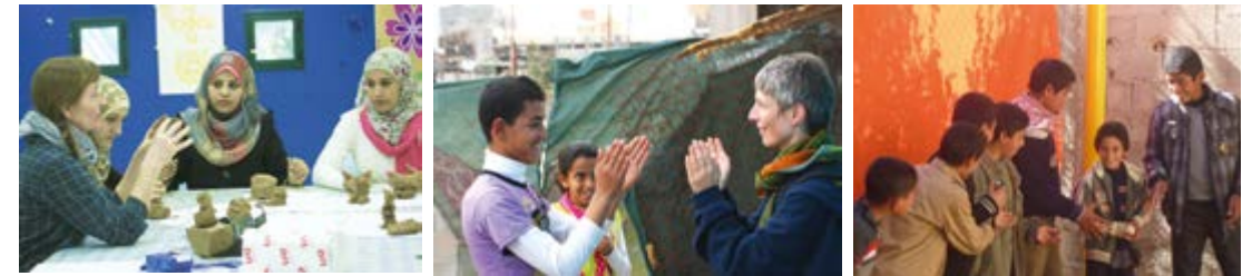
Modelado con trabajadoras del Al Qattan Centre; juegos de ritmo y coordinación con niños

Las disputas de guerra de noviembre 2012 hacen que el trabajo en la Franja de Gaza sea más importante que nunca, pero al mismo tiempo en febrero 2013 se terminó la financiación recibida del Departamento de Relaciones Exteriores.