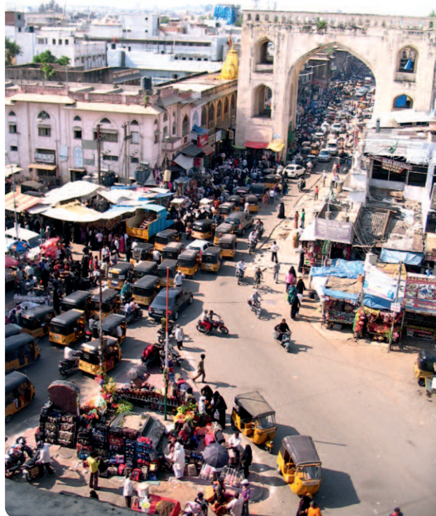
Eindrücke von Hyderabad und der Vierten Asia- tischen Waldorf- lehrertagung 2011, Indien.