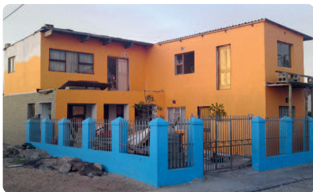
Von links nach rechts: Das neue Masakhe Educare Centre in Khayelitsha, Südafrika, rechts daneben der neue Bus.

Auch nach Kapstadt an das Centre for Creative Education