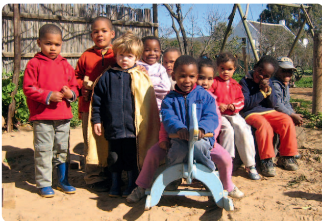
Gebäude und Spielgruppe der McGregor Waldorf School in Südafrika.