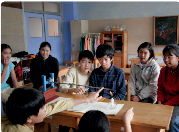
Physikunterricht in der 7. Klasse in Fujino, Japan.

Eurythmielehrerin, Fujino Steiner School