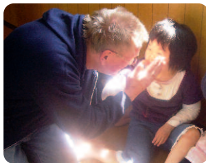
Oben: Bei einem Notfallpädagogischen Einsatz in Japan. Darunter: Malen in Onagawa, Japan. Kleines Bild unten: Heilpädagogik in Rifu, Japan.