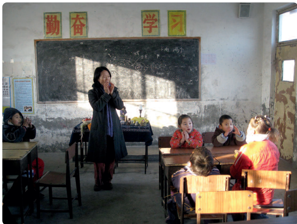
Oben: Bei Wu Bei in Peking. Darunter: In Guangzhou, China.