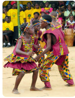
Links: Lebens- gemeinschaft TEMI, Georgien. Rechts: Fest in Baobab, Ghana.

(CfCE) wurden Mitte 2009 erste 29 weltwärts-Freiwillige vermittelt. Das CfCE ist die einzige Waldorfflehrerausbildungsstätte in ganz Afrika. Von dort aus werden außerdem über 50 Kindergärten und die Zenzeleni Waldorf School im Township Khayelitsha betreut und unterstützt. So positiv die Entwicklung der Kindergärten auch ist, so bescheiden und improvisiert sind die Mittel, mit denen dort gearbeitet wird. Zwei bis drei Frauen betreuen bis zu 120 Kinder in oft sehr beengten Räumen. Nun stand das CfCE vor der großen Möglichkeit, aber auch gleichzeitig vor der Herausforderung, weltwärts-Freiwillige in den Kindergärten des Townships mitarbeiten zu lassen. Mit einem neuen Kindergartenausbau und einem neuen Bus, der die Freiwilligen sicher in die Einrichtungen des