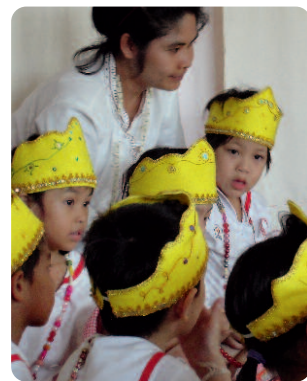
Großes Bild: Aufführung in der Tridhaksa School in Bangkok, Thailand.