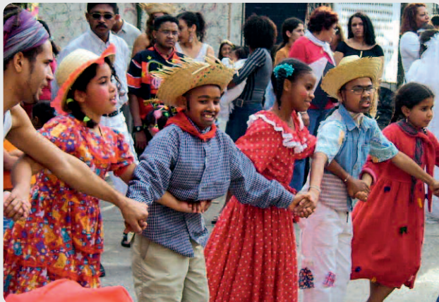
Oben: Kinder der McGregor Waldorf School, Südafrika. Unten: Johanni- feier in der Favela Monte Azul in São Paulo, Brasilien.

Nach Afrika konnten wir im Jahr 2010 über eine Millionen Euro überweisen. Die Rudolf Steiner Schule in Mbagathi in Nairobi, Kenia konnte das Wohnheim erweitern und zwei zusätzliche Unterrichtsräume bauen. Außerdem haben wir die Schule mit einem Darlehen für den Landkauf und die geplante Berufs- und Oberstufenausbildung unterstützt. Die meisten Mittel für Afrika gingen mit über 400.000 € nach Südafrika. Seit Jahren arbeiten wir für den Aufbau der Educare Centres in den Townships von Kapstadt eng mit dem Centre for Creative Education in Kapstadt zusammen. Neben der Ausbildung der Erzieherinnen haben wir auch die räumliche Situation für die Betreuung der Kleinkinder durch kleinere Bauprojekte