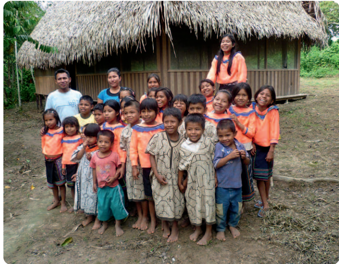
Shipibo-Kinder aus Estrella del Sur in Tarapoto und ein Kind aus Pro Humanus in Chinchá, Peru (links).

Schuldirektoren alles ändern. Sie haben bereits Interesse für die Waldorfpädagogik geäußert und wollen die Bildungssituation bei Tarapoto deutlich verbessern. Über Abend- und Wochenendkurse in Englisch, in Lesen und Schreiben und mit praktischen Kursen in Holzarbeit und Nähen für junge Mütter hat das Projekt bereits begonnen. Das Bildungszentrum soll in Zukunft als soziale Anlaufstelle dienen und endlich für die Menschen vor Ort bessere Bildungsmöglichkeiten bieten.