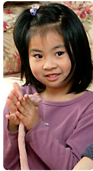
Großes Bild: Drachentanz in Chengdu. Kleines Bild rechts: Mädchen in Hongkong.

China mehr als 120 Kindergärten und neun Grundschulen, deren Zahl dieses Jahr auf bis zu 18 Schulen steigen soll. Obwohl viele Eltern zur Waldorfpädagogik erst über die Montessori Bildung kamen, hat sich Jahr für Jahr aus einer ersten Neugierde, ein wahres Verlangen nach Waldorfbildung entwickelt.