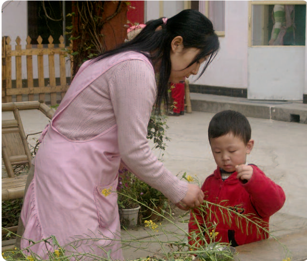
Darunter: Chengdu Waldorf School. Kleines Bild rechts: Bei der Reisernte in Taichung, Taiwan.

vorhersehbar (im September ist die Zahl der Kindergartengruppen auf 172 gestiegen), für den allerdings noch sehr viel kollegiale Begleitung notwendig sein wird.