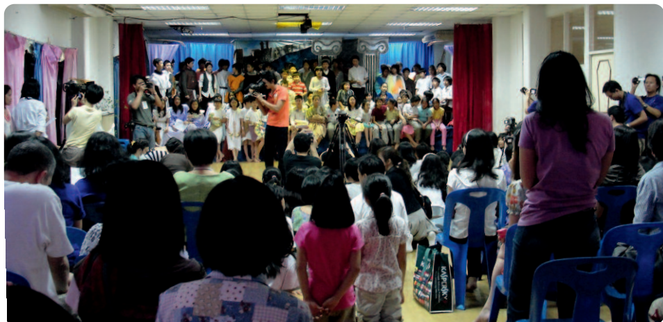
Kleines Bild: Kinder der Tridhaksa School.