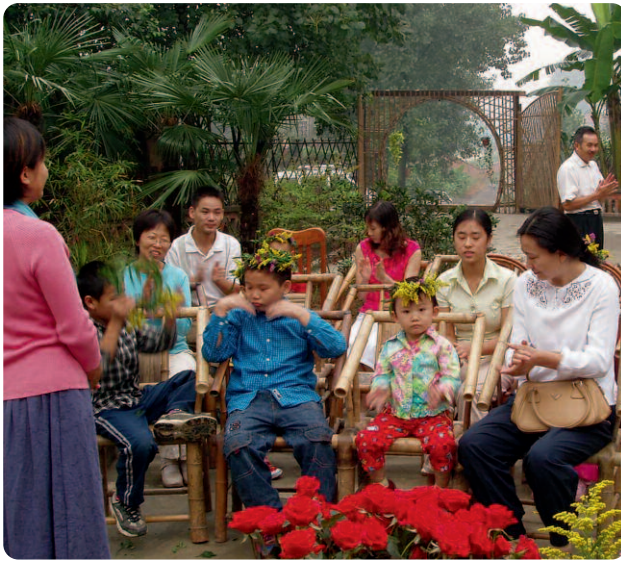
Oben: Eröffnungstag in Chengdu.