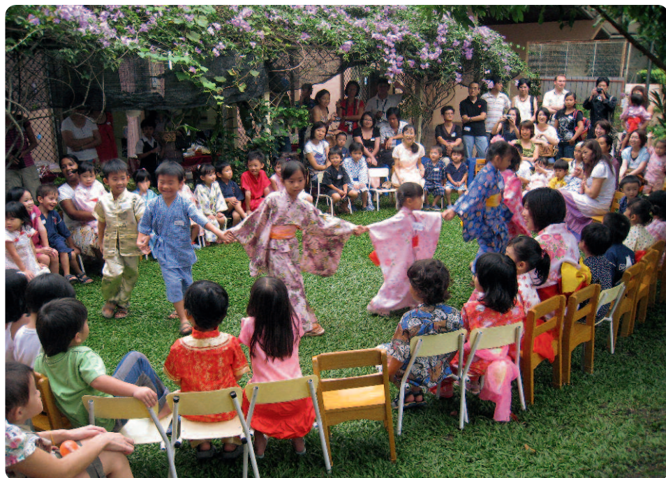
Nania Waldorf School in Penang.

liches ansprechen. Nania besuchen derzeit 52 Kinder und bereits jetzt hat der Kindergarten eine einjährige Warteliste.