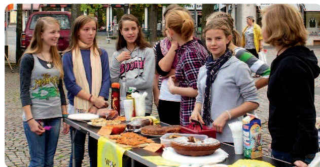
WOW-Day-Aktionen in Göttingen (linke Seite) und Sankt Augustin (rechts).

Mit dem letzten WOW-Day Beitrag konnten wir im Rahmen des Projekts "Schule unterwegs" in vier Andendörfern der Region Huancavelica regelmäßig Kinder, Lehrer und Eltern in Kindergärten und Schulen begleiten sowie Unterrichtsmaterialien und Mobiliar zur Verfügung stellen. Denn gerade in einem sozialen Umfeld, in welchem viele Indigene