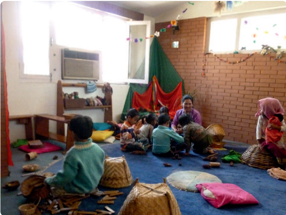
Kindergarten der Tashi Waldorf School, Kathmandu, Nepal.