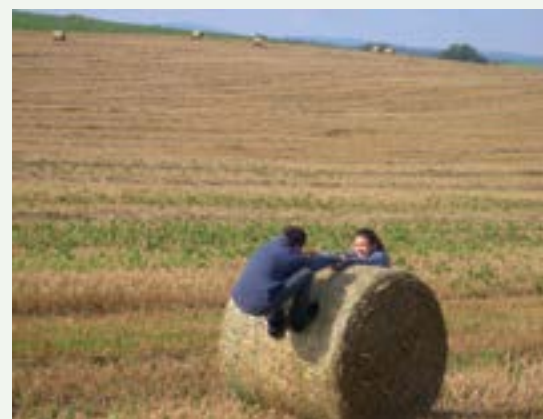
Página izquierda: Encuentro internacional de voluntarios nacionales en Karlsruhe, Abril 2012; derecha arriba: transporte conjunto de los frutos de la cosecha; abajo: ser humano y naturaleza en consonancia – servicio voluntario en la agricultura bio-dinámica