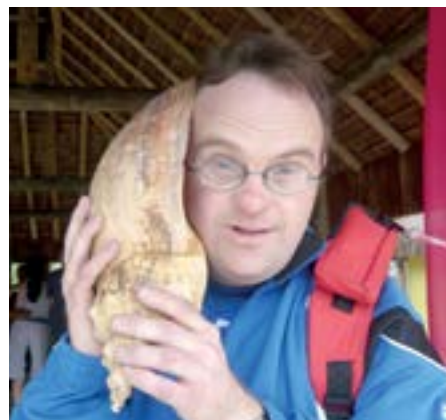
5° Congreso „Vivir el encuentro“, Viena 2011; Congreso en Brasil 2010: un participante llama a su casa

Su lema para este congreso fue: “Primero aprender más acerca de Rudolf Steiner y la Antroposofía, y segundo acerca de las otras personas con discapacidad”. Agregó: “Por supuesto que desde allí no aparece un poder político, sino uno espiritual. No hablo de religión sino de nosotros, los seres humanos”. Y cerró su aporte en medio del fuerte apoyo de los asistentes: “Tenemos que creer en nosotros mismos y en cada uno de los otros. Si nos ayudamos los unos a los otros, podemos lograrlo juntos”.