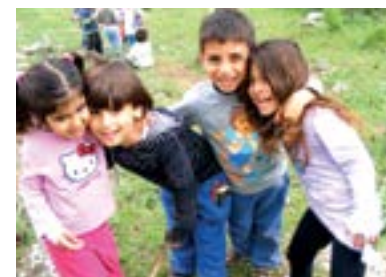
Página izquierda: fiesta de peregrinos en Shavuot; página derecha arriba: en el Jardín de Infancia; abajo: en una excursión