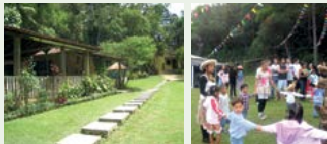
Arriba: representación en Pequeno Príncipe; derecha centro: pausa del desayuno; izquierda abajo: festejo en el jardín