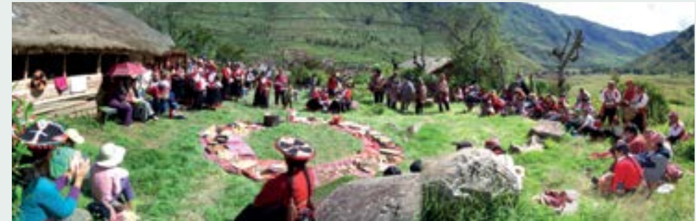
Página derecha: festejo de Pukllay, la ceremonia de la fertilidad; edificio escolar; página izquierda: escenas de la escuela; centro: ritual para agradecer el alimento; abajo: visita de Nana Göbel