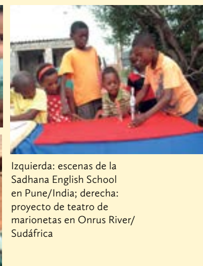
Izquierda: escenas de la Sadhana English School en Pune/India; derecha: proyecto de teatro de marionetas en Onrus River/ Sudáfrica