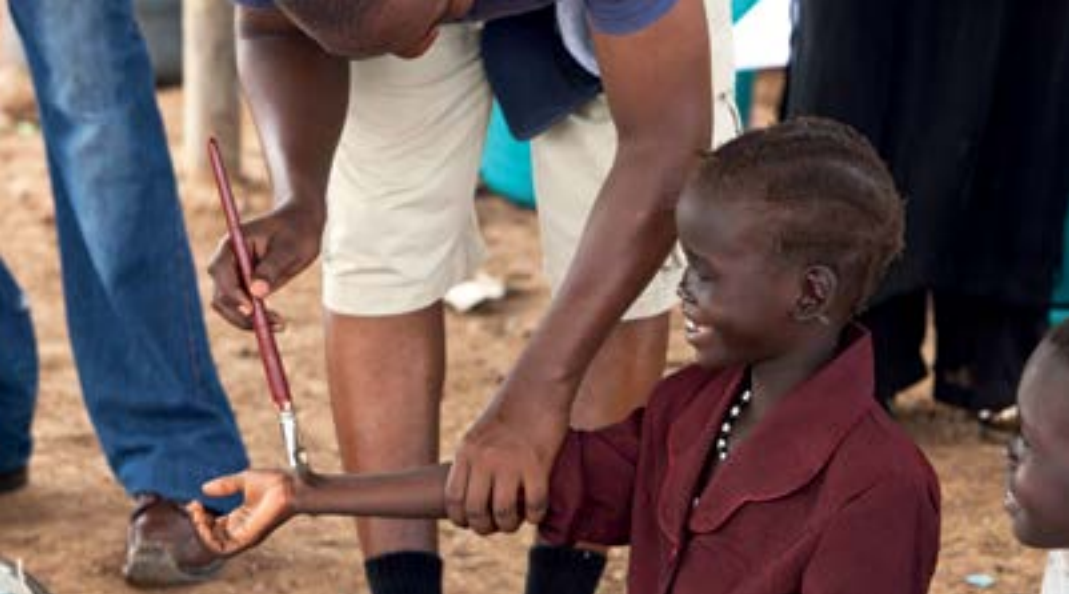
intervención de Pedagogía de Emergencia en el centro de refugiados Kakuma, Kenia 2012 ; derecha: Escuela Caracol/Guatemala