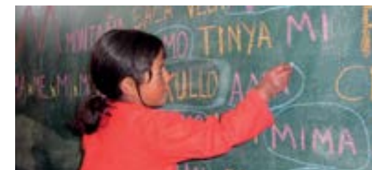
Pro Humanus, Peru

Más allá de esto, por ejemplo en Inglaterra, Hungría, Rumania, Lituania, Estonia, Ucrania,