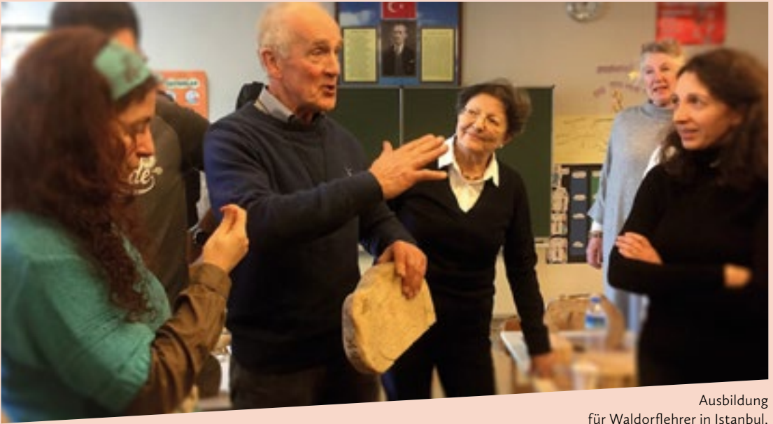
Ausbildung für Waldorflehrer in Istanbul.