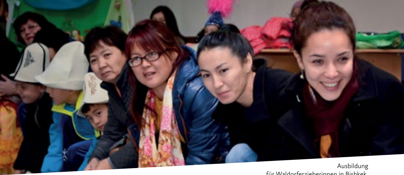
Ausbildung für Waldorferzieherinnen in Bishkek.

ermöglichen und denken daran, es bei einem nächsten Kurs zur Pflicht zu machen.