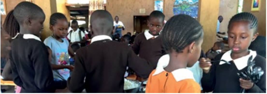
Essensausgabe in der Mensa der Waldorfschule in Mbagathi/Nairobi.

wurde ein Bewässerungssystem eingerichtet. In der traditionellen afrikanischen Kultur herrschte ein sehr achtsames Verhältnis im Umgang mit der Natur, aber zugleich ein leidvolles, denn man war den Kapriolen des Wetters hilflos ausgeliefert. Solange keine totale Dürre herrscht wie im letzten Jahr, können durch die Bewässerungssysteme, eine ausreichende Beschattung der Gartenflächen und einen guten Umgang mit Kompost und Mulch selbst in trockenen Jahreszeiten Gemüsepflanzen wachsen.