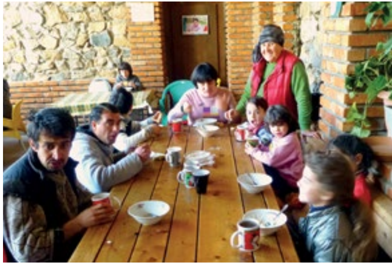
Ein Ort der Gemeinschaft: Das Sozialprojekt Temi in Georgien.

der kleineren Wohnhäuser. Manche in Doppelzimmern oder als ganze Familie in einem Einzelzimmer. Um die Kinder behinderter Eltern kümmern sich alle. Es finden sich die unterschiedlichsten Lebens(abschnitts)entwürfe.