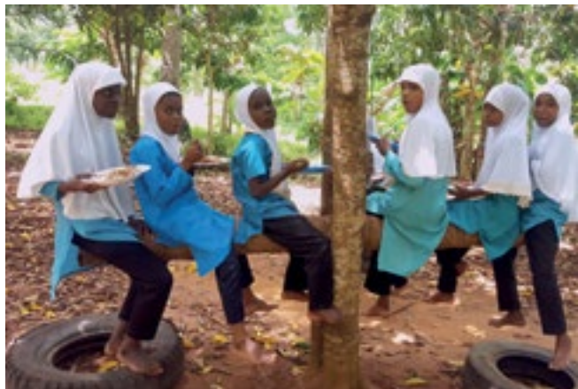
Mittagessen auf dem Pausenhof.

In den ersten zwei Schuljahren ist Swahili Unterrichtssprache, ab der dritten Klasse wird der Hauptunterricht in Englisch erteilt. Der in Mitteleuropa vieldiskutierten Pflege der unteren Sinne kommt die warme, üppige Natur entgegen. Hier geht es barfuß in den Schul-Dschungel, und wer sich Mandarinen, Bananen, Papaya, Mangos, Kokosnüsse, Litschis und weiß Gott was sonst alles beschaffen will, muss und kann es sich erklettern. Aber auch Ballspiele sind, wie überall auf der Erde, eine beliebte Pausenbeschäftigung. Kinder und Lehrerinnen