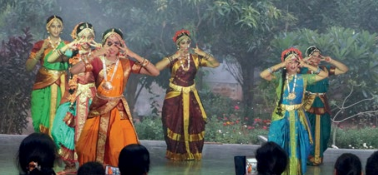
Tanz bei einer Schulveranstaltung in der Waldorfschule in Hyderabad.

zeugen sollen. Eltern, so erzählten uns die Kollegen dort, müssen die Schule erst sehen und gewinnen dann Vertrauen; sie lassen sich nicht durch eine Idee überzeugen. Während in Myanmar und in Vietnam die ersten Waldorfschulen gerade beginnen und noch ganz mit Pioniereifer betrieben werden, feiert die Sloka Waldorfschule in Hyderabad, Indien in diesem Jahr ihr 20-jähriges Bestehen. Über 600 Schüler besuchen mittlerweile diese Schule, die sich nationale Anerkennung erworben hat. In Indien ist die Waldorfpädagogik – zumindest in der Klassenlehrerzeit – angekommen. So baten wir die Kollegen der Sloka-Schule Praktikumsplätze für die neuen Lehrer der Tashi-Schule in Nepal bereit zu stellen, damit sie auch einmal eine gut funktionierende große Waldorfschule erleben können. Solche gegenseitige Unterstützungen in einem vergleichbaren kulturellen Kontext werden immer wichtiger und von den etablierten Schulen auch gerne geleistet. In Thailand zum Beispiel erhalten die neuen Schulinitiativen, so etwa die Schule in Chiang Mai, regelmäßig Unterstützung durch die erfahrene, ebenfalls zwanzigjährige Panyotai Waldorfschule in Bangkok.