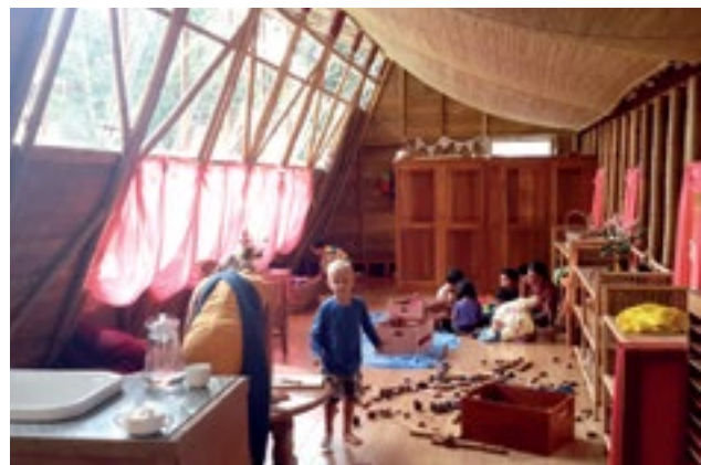
Links: Kindergarten in Timisoara, Rumänien. Rechts: Kindergarten in der Waldorfschule in Myanmar.